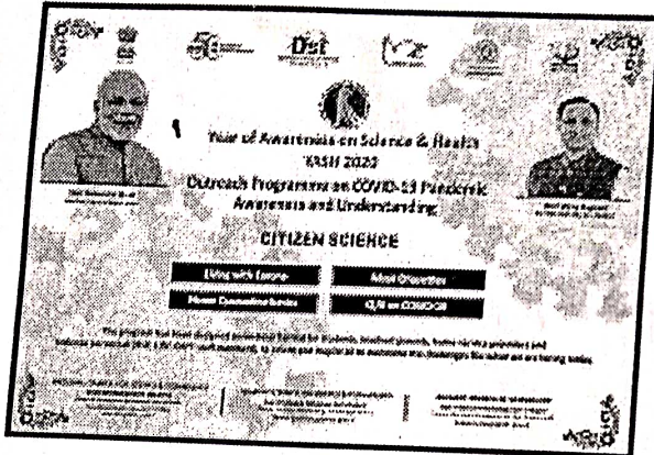
Letter in Guj.(DEO-Surat).pdf 1088K